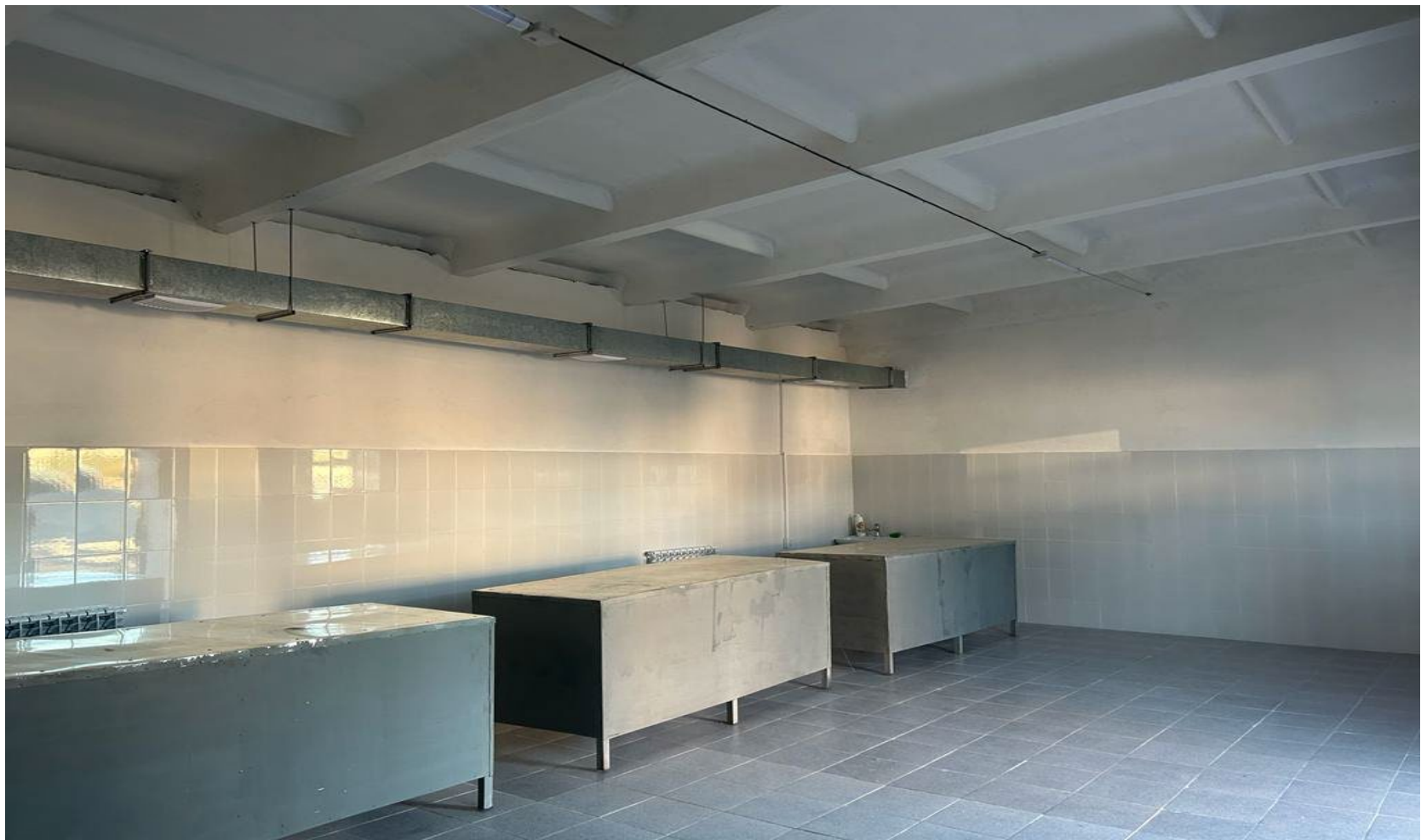
Рыбный отдел 51м2