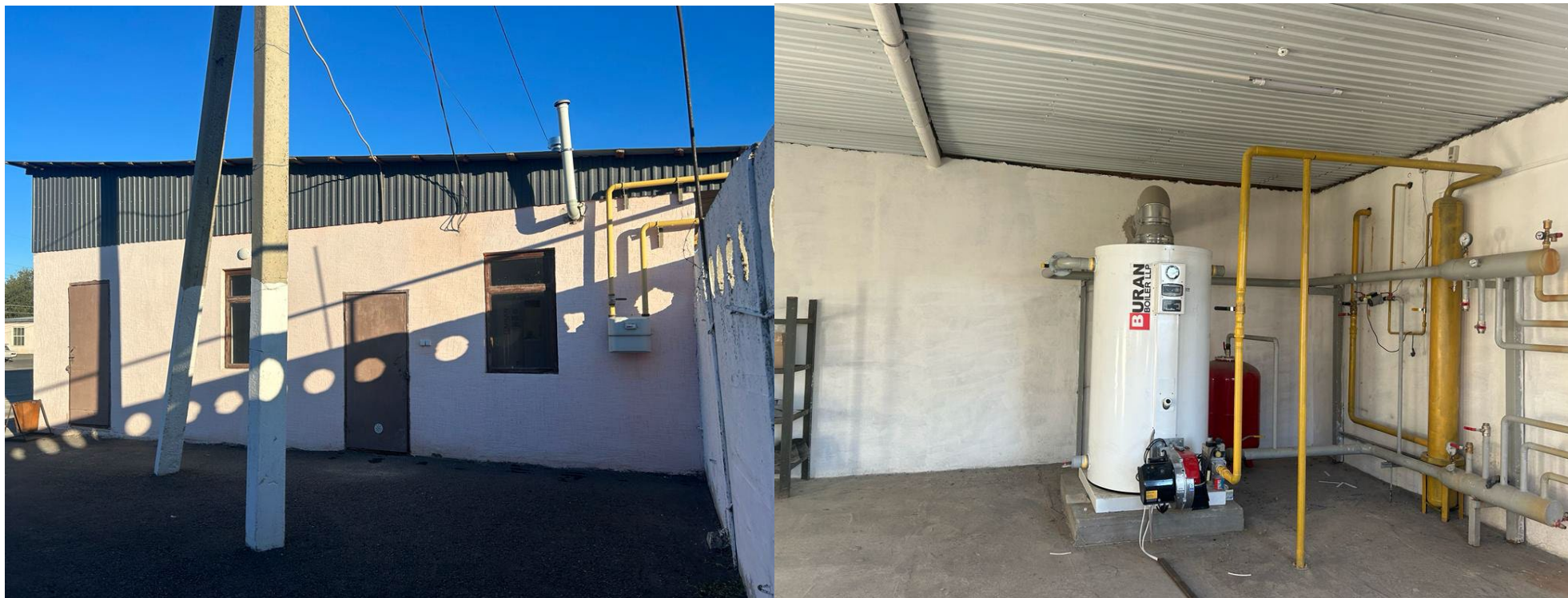
Котельная (на газовой печке мощностью 3000м2) 42м2