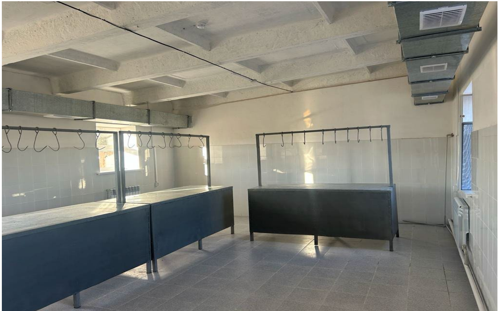
Мясной магазин 55,5м 2