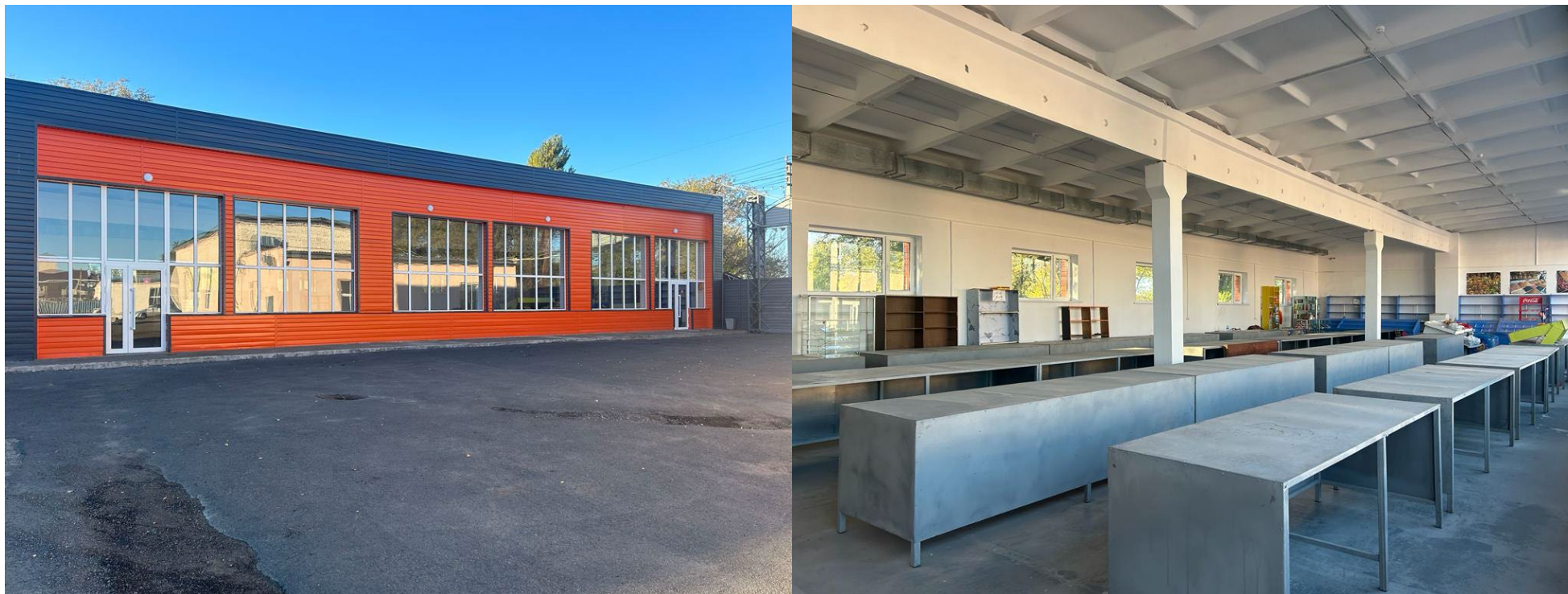
Магазин общая площадь 348м 2