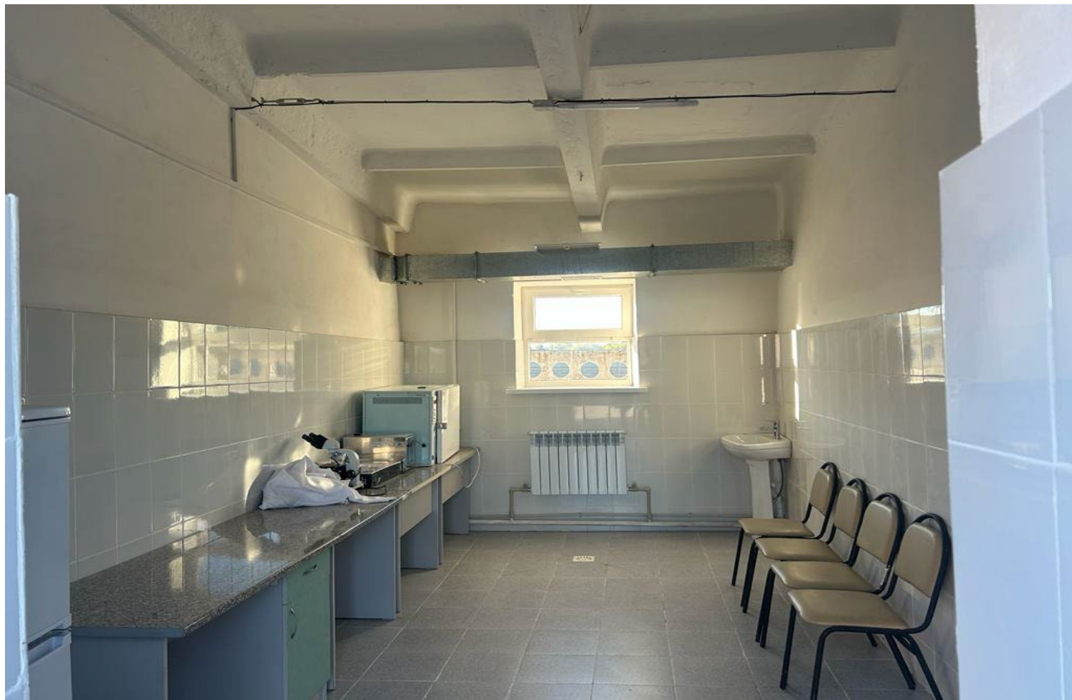
Лаборатория 16,5м 2