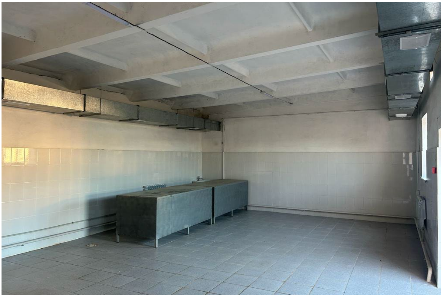
Магазин (молочка) 52м2