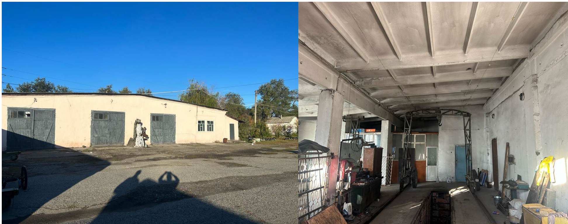
Ремонтные мастерские (гараж) 478,7м2