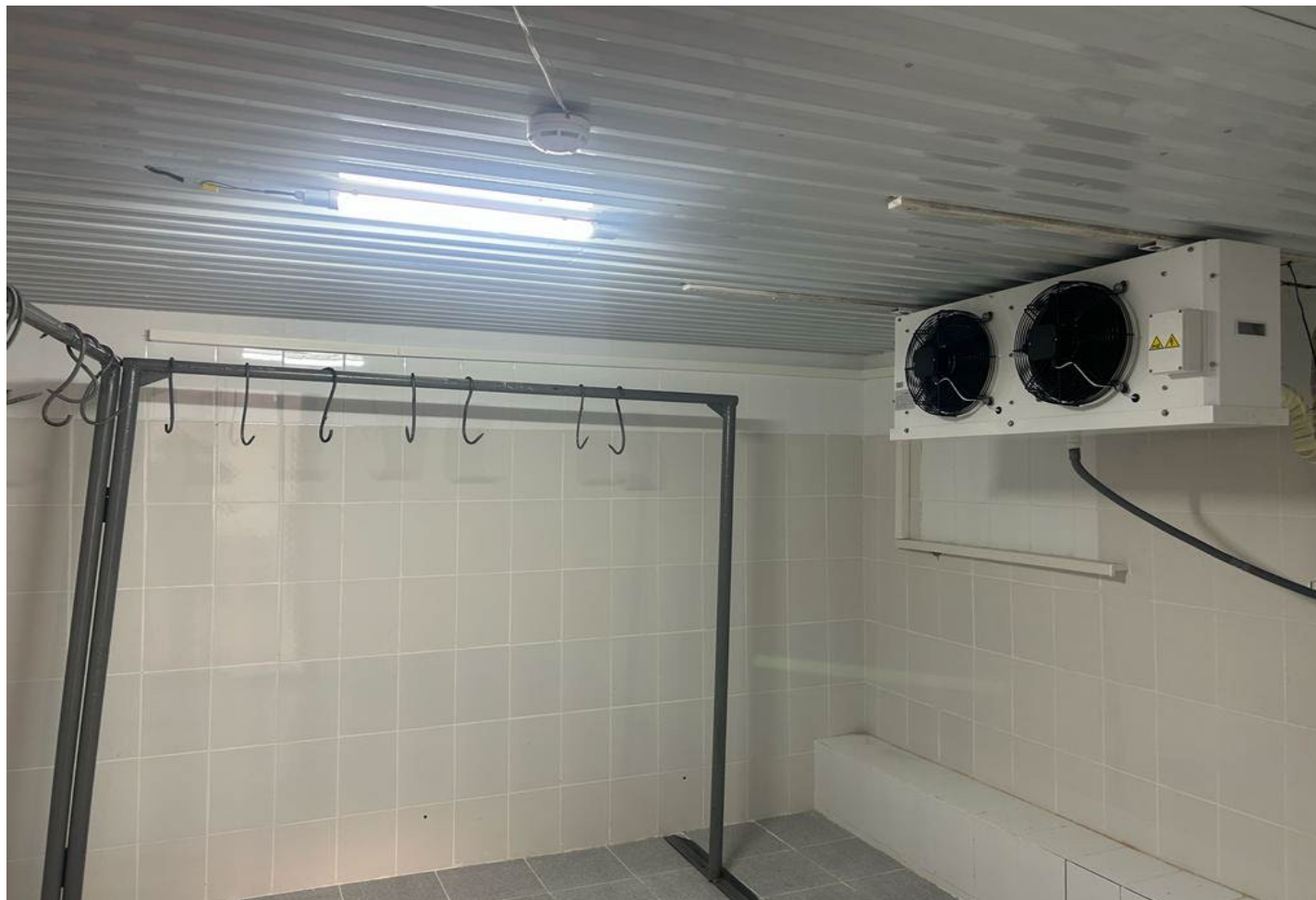
Морозильная камера (для мяса) 14,4м 2