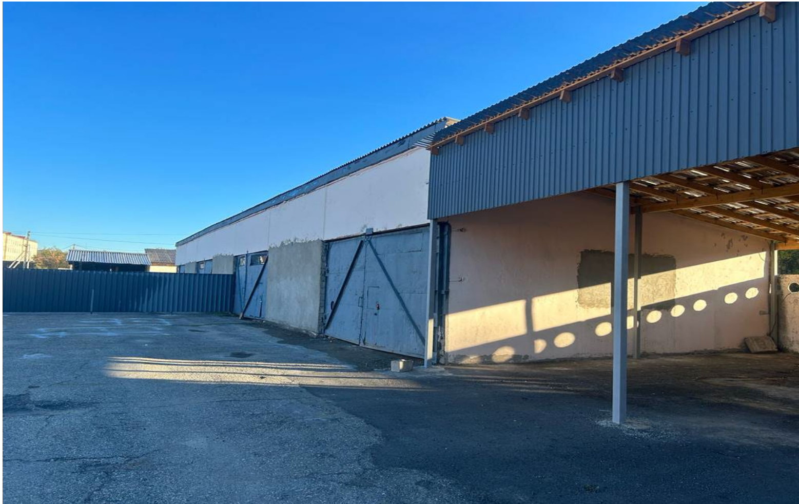
Овощехранилище общая площадь 378м 2