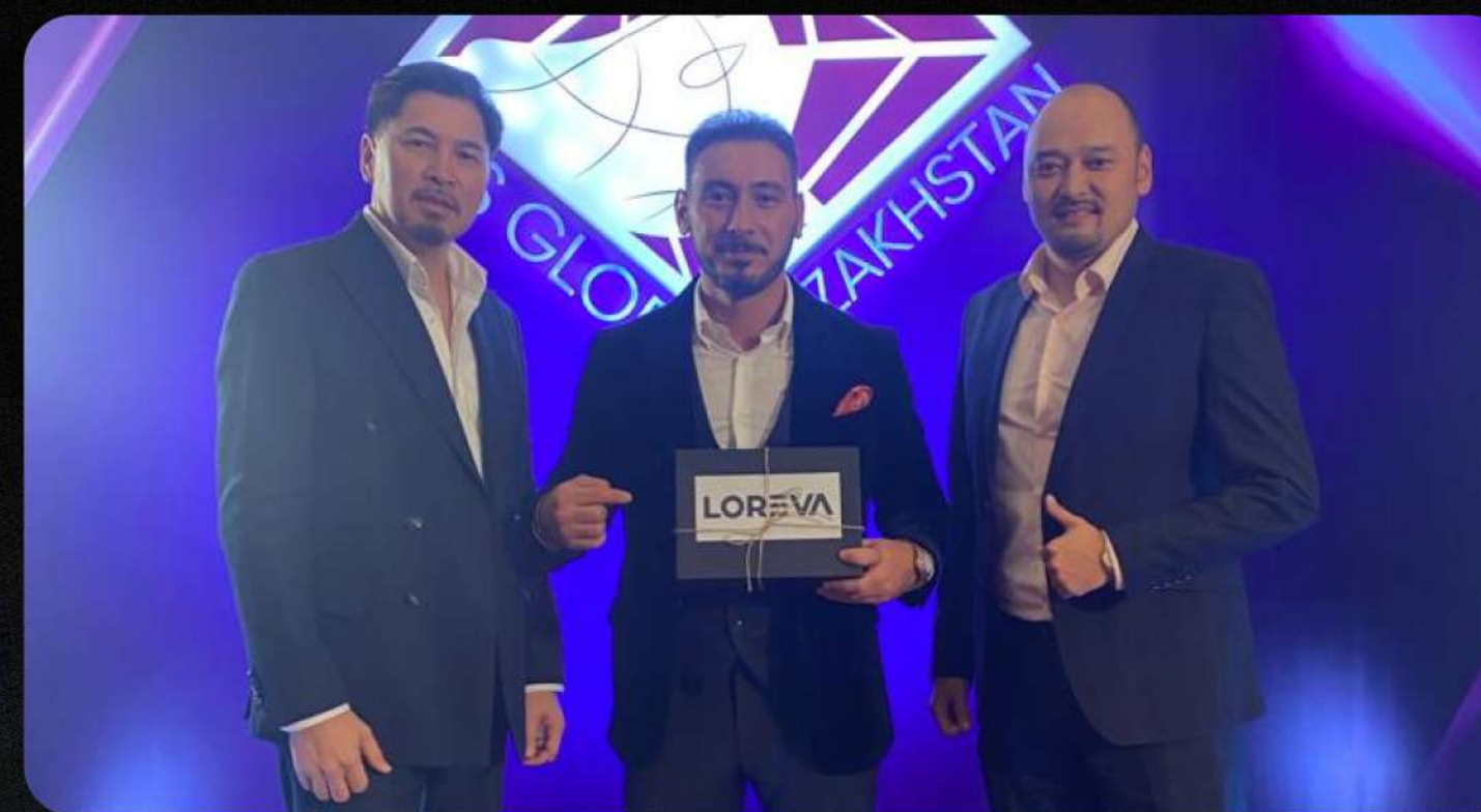
Представители LOREVA на конкурсе MRS. GLOBE KAZAKHSTAN 2022