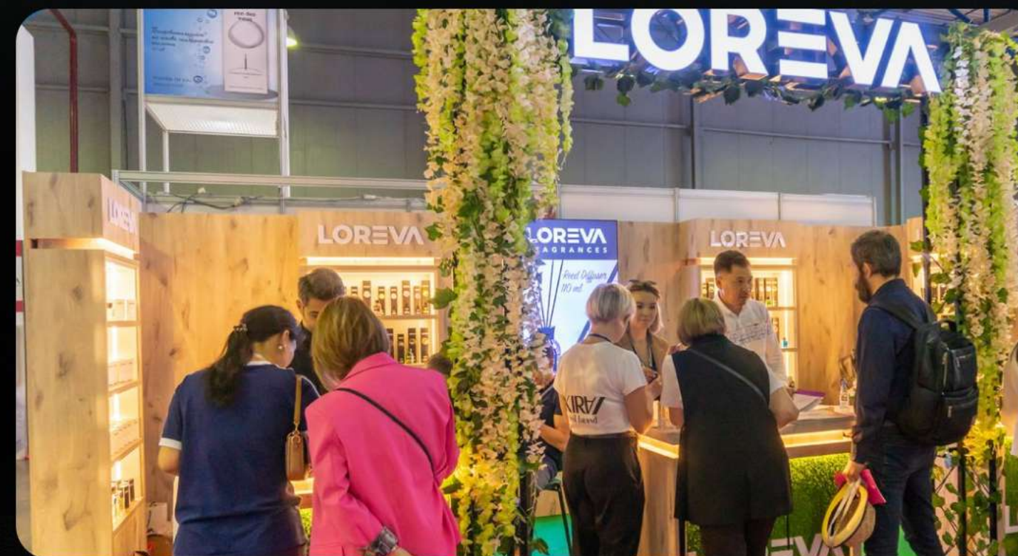
Выставка Индустрии Красоты и Косметики Central Asia Beauty Expo 2022

Мы занимаем лидирующее место в своей категории!