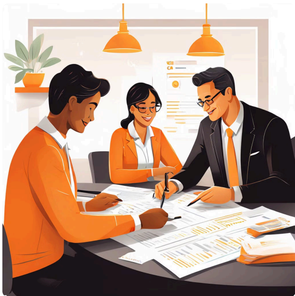
Договор и Оплата